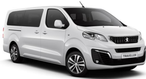
Blanc Banquise (Κωδικός: WPP0)