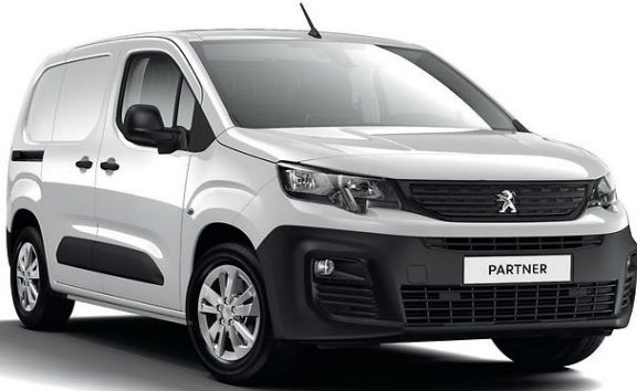
Blanc Icy (Κωδικός: PRP0)